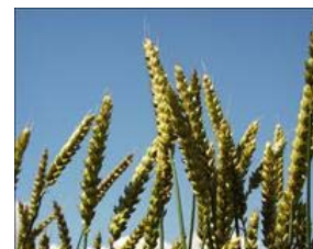
Vinterhvede er reeltivt krævende med hensyn til sædskifte, jordtype og gødsning

Vinterhvede er relativt krævende med hensyn til sædskifte, jordtype og gødsning. Hvis det er hensigten at dyrke foderkorn, er det ofte et bedre alternativ at dyrke vintertriticale. Vintertriticale giver under økologisk dyrkning det samme, eller et bedre udbytte, og afregningsprisen er næsten den samme.