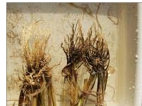
Goldfodsyge kan være et problem, hvor de er meget kvik i marken.

Angreb af bladlus forekommer især under varme og tørre vejrforhold. Bladlus kan overføre havrerødsotvirus om efteråret. Risikoen er størst ved meget tidlig såning og