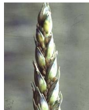
Angreb af bladlus forekommer især under varme og tørre vejrforhold.

På lerede jorder optræder der i visse efterår angreb af agersnegle. Sort jord (pløjning eller hyppige harvninger) i længst mulig tid før såning af vinterhvede nedsætter risikoen for angreb, men desværre øges N-omsætningen med risiko for udvaskning. Undgå overfladisk såning.