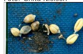
Stinkbrand kan være yderst tabsgivende. Hvedekerner angrebet af stinkbrand samt stinkbrandssporer fra knuste kerner. To sunde hvedekerner ses til højre.